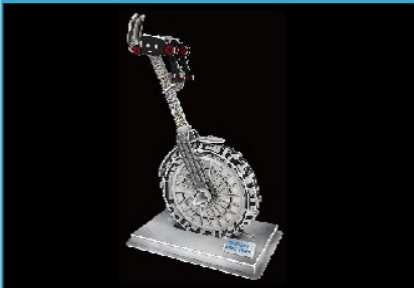
스페이스 오딧세이 조형물 모양 입체퍼즐 만들기