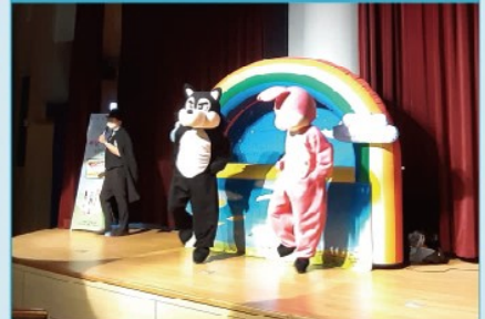
어린이날을 맞아 과학적 요소를 포함한 뮤지컬 공연