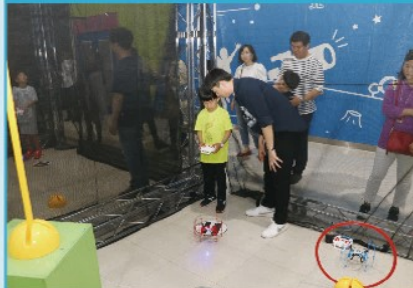
드론축구, 드론 착륙작전, 드론 닥트 등 드론관련 다양한 체험