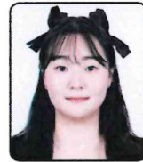
촬영 및 연기 조화인 선생님