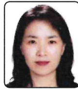
연출 및 무대 구성 김지은 선생님