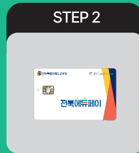
전북에듀페이 바우처카드 신청