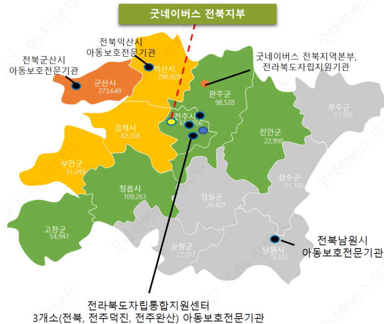
전라북도 14개 시군 교육기관 사업 및 위기가정사업 진행