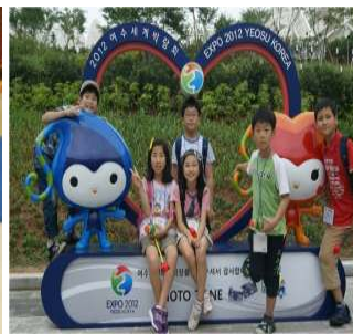
▶ 여수해양 엑스포 현장학습(7월17일)