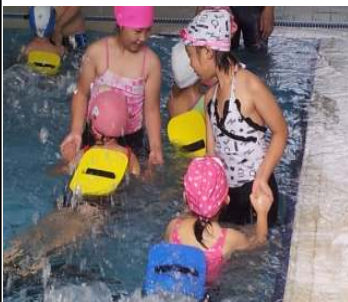
▶ 수영장에서 (7.13일-1,2,3학년)

송광어린이들은 교육 활동에서 이루어지는 신체활동, 문화, 예절과 관련된 교육시간을 좀 더 효율적으로 경험하기 위하여 다양한 인성체험 활동에 참여하였습니다. 어린이들은 체험활동을 통해 자아성찰의 기회를 갖고, 자존감 형성하며 스포츠 문화 활동을 경험하는 좋은 기회를 가졌습니다.