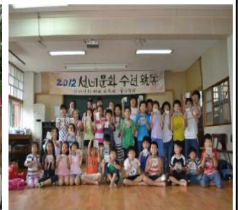
▶ 선비문화체험 (7.20~21일)