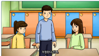
학교폭력 예방교육 동영상(초등용)

학교폭력 예방교육 동영상은 통해 학교폭력이 무엇인지, 학교폭력을 경험했을 때 어떻게 행동해야 하는지를 학습할 수 있습니다.