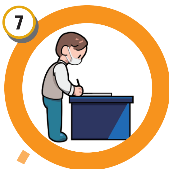
응시원서 내용 확인 후 사진부착 및 날인(서명)