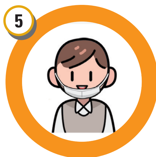
본인 확인(신분증, 부착용 사진 확인을 위하여 마스크는 잠깐 내리기)