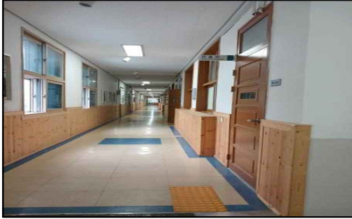
1층 계단 옆에 위치함