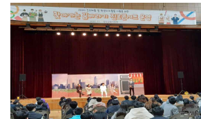
진로뮤지컬 공연 후 토크콘서트 (장수고, 백화여고)