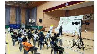
맞춤형 진로연극 수업 중 조명에 대한 수업 실시 (장수초)