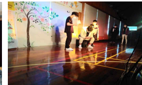
학교로 찾아가는 맞춤형 진로연 극프로그램 학생 참여 (계북중)