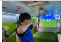
XR 스마트 스크린 체험