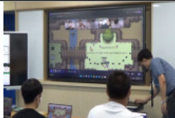
메타버스 활용 수학 교과 수업