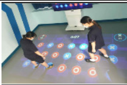
모션인식 및 액션플로우 활용 신체활동