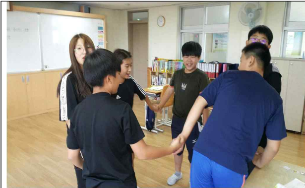
굿에너지 인성교육 수업 '함께하는 소중한'