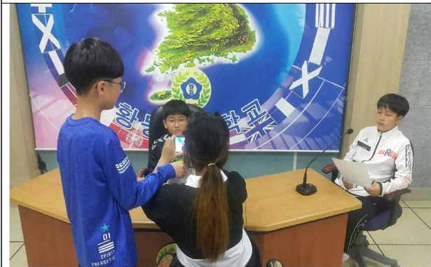
굿에너지로 따뜻한 세상 만들기2 빛깔 자치영상 제작 활동