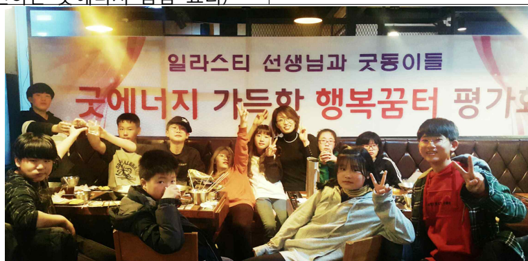
굿에너지 가득한 행복꿈터 평가회