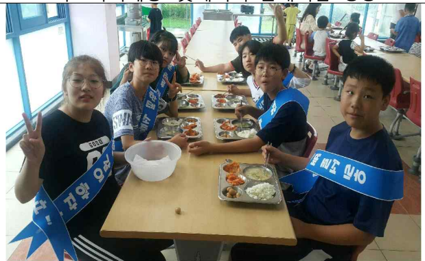
굿에너지로 따뜻한 세상 만들기3 '따뜻한 말 한마디' 캠페인