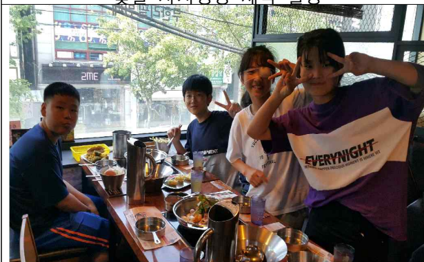
봄빛깔 굿에너지 파티 (내 친구에게 전하는 굿에너지 뽐뽐 요리)