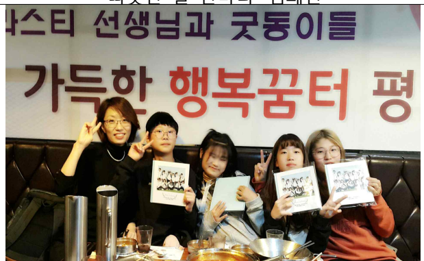
우리들만의 작은 굿에너지 졸업식