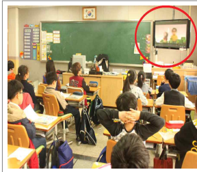
EBS 인성 VOD 시청