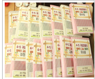
성장 앨범 만들기