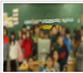
내가 찾은 가치 보물