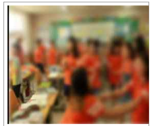
둘이 아닌 하나되기