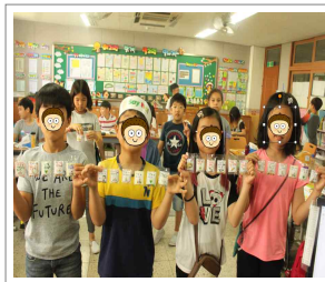
사랑의 약 제작