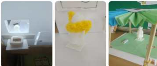
[작은 소녀상 3D모델을 활용한 작품]