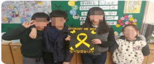
[모듬별 세월호 기억 작품 제작]