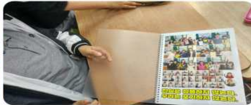
[컬러링 작품 모아 제작한 책]