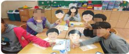
[감정 읽기 활동]