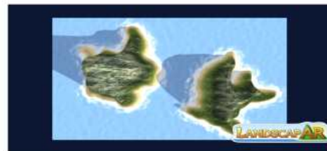
[독도를 가상현실로 표현]