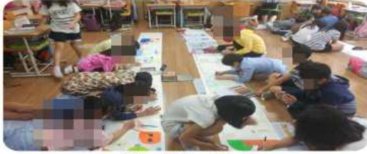
[협동 작품 만들기]