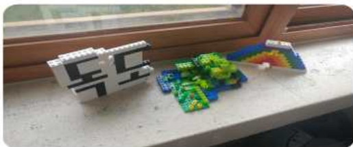
[블록을 활용한 독도 입체작품]