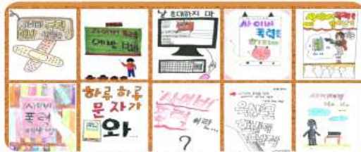
[사이버폭력예방 책 표지 디자인]