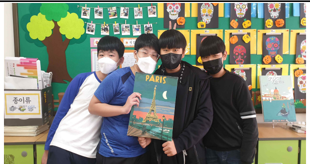
6학년 문예부 동아리 아크릴화 그리기