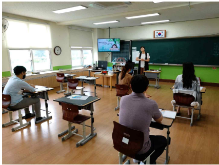
생각이 보이는 비주얼씽킹 교원 연수