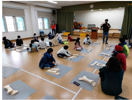
만들며 꿈꾸는 목공체험