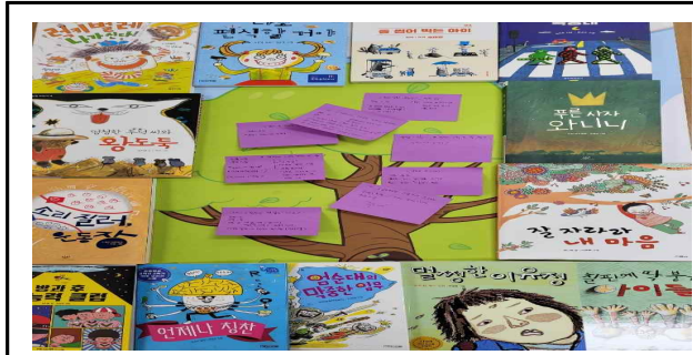
3학년 도서 구입