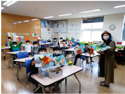
그림책과 북아트 독서행사