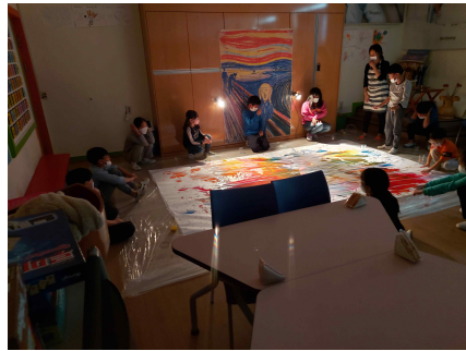
신나는 퍼포먼스 미술 체험활동