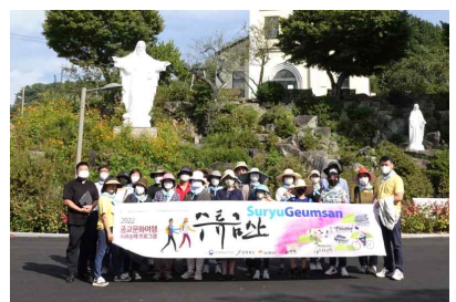
수류금산 성소 방문