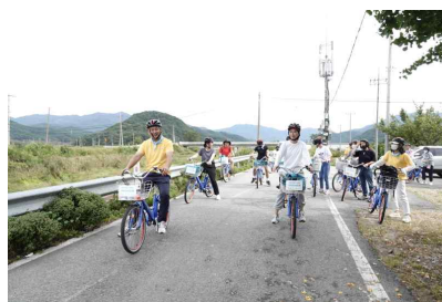
수류금산 자전거 라이딩