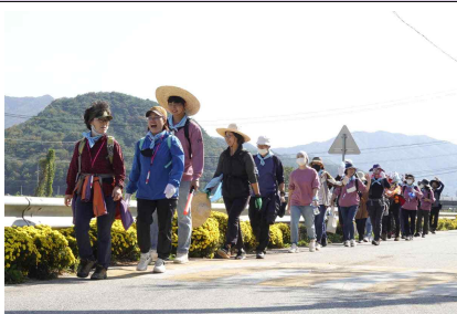
수류금산 순례길 걷기