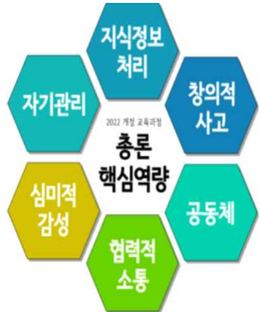
<100인의 명사들이 꼽은 미래에 필요한 핵심 역량>1)