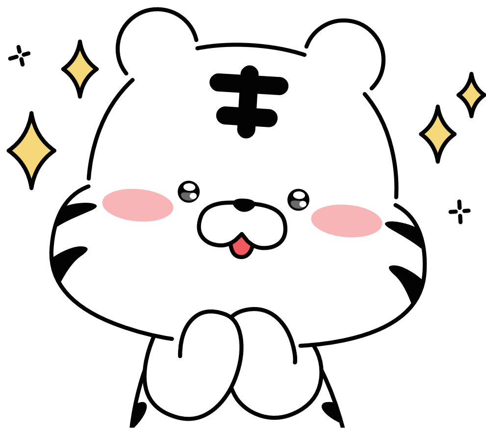
KSPO 마스코트 백호돌이