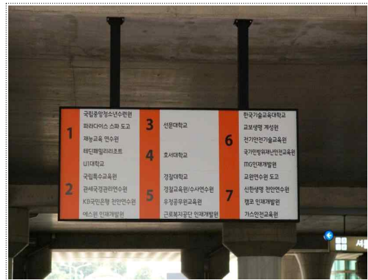
3) 셔틀버스 안내판 보임(② 국립특수교육원)