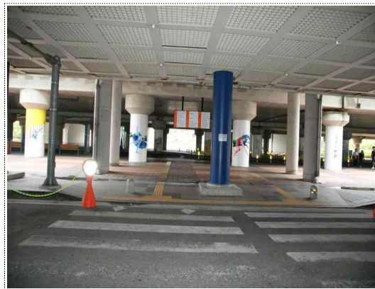
2) 횡단보도 2개 건넌