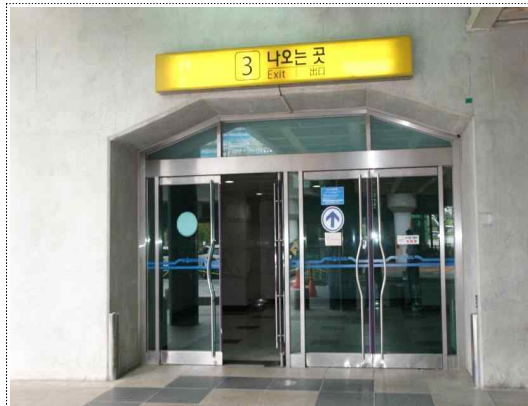
1) 천안아산역 ③번 출구