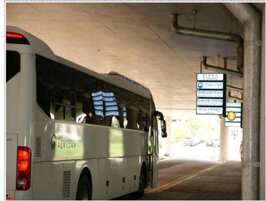
5) ②번 국립특수교육원 셔틀버스 탑승