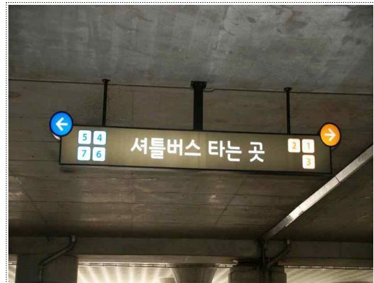
4) 셔틀버스 전광판에서 우측 ②번 방향