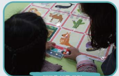
핸즈온 블록 코딩

6월 중 온라인 과학교실 프로그램을 새롭게 선보일 예정입니다. 관람객 여러분의 많은 참여 부탁드립니다.(자세한 내용은 홈페이지 참조)