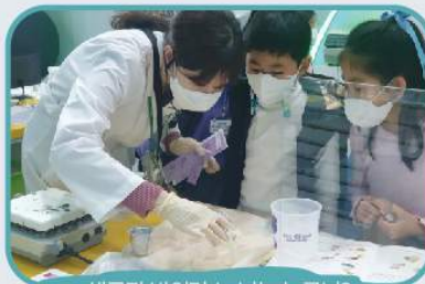
세균과 바이러스, 너는 누구니?