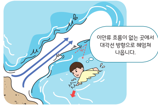
< 이안류 탈출 요령 >