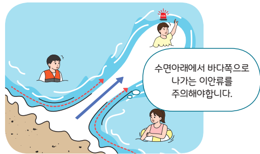
< 이안류(거꾸로 치는 파도) >

** 수면아래에서 바다 쪽으로 나가는 강한 역류성 흐름(최고 3m/sec)