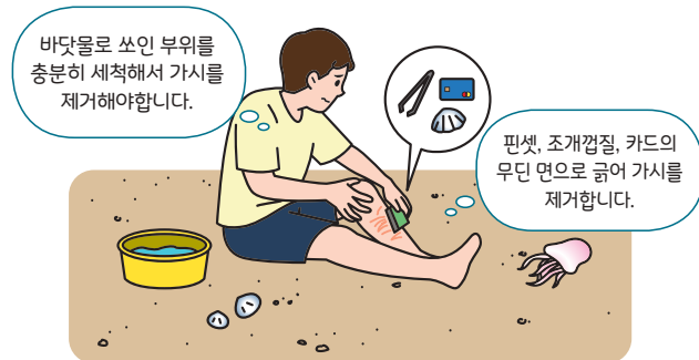
< 해파리에 쏘인 경우 대처요령 >