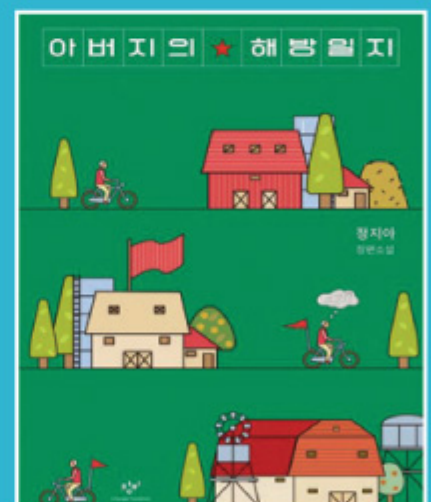
아버지의 해방일지 〈정지아〉