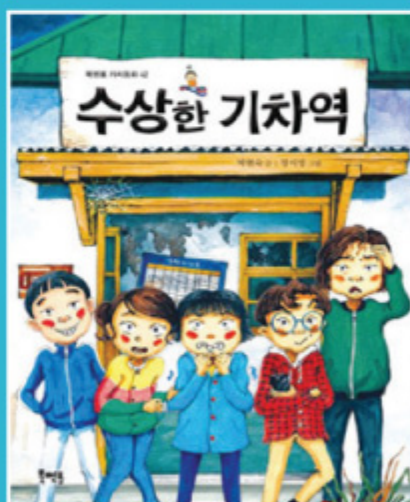
수상한 기차역 〈박현숙〉