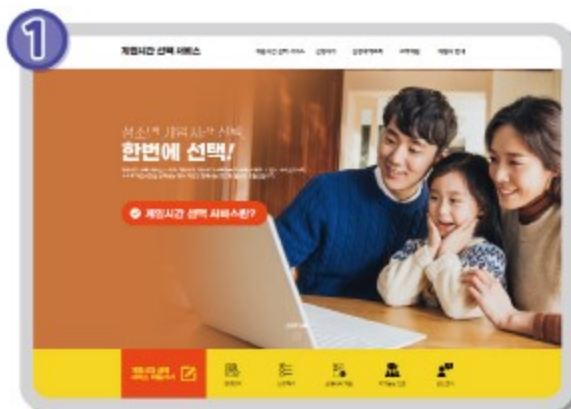
게임시간 선택 서비스 홈페이지 (www.gamehour.or.kr) 접속