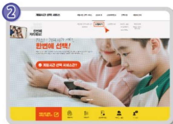
메뉴 신청하기 선택