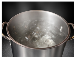
조리도구 열탕소독 또는 염소소독 실시