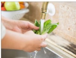
흐르는 물에 3회 이상 세척