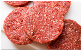
쇠고기(특히 간 쇠고기, 햄버거) 및 쇠고기 육제품(햄, 소시지)