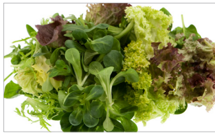
시금치, 상추 등 생채소, 새싹채소 및 샐러드, 과일