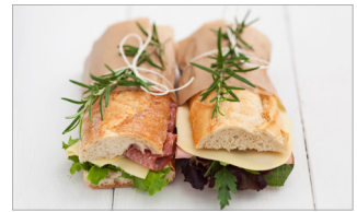
보균자에 의해 조리된 식품 (도시락, 샌드위치)