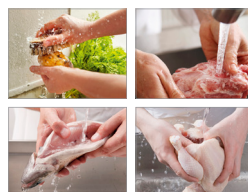
채소류→육류→어패류 →가금류 순으로 세척