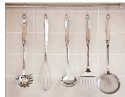
용도별 조리도구 구분 사용