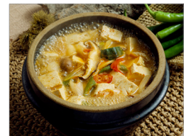
무더운 여름에는 가열(75℃ 이상)식품 위주로 섭취