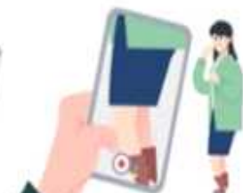
성폭력 범죄, 성희롱