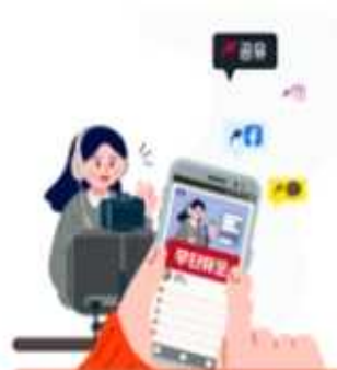
교육활동 중인 선생님의 영상·사진·음성 무단 유포