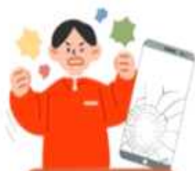
상해·폭행, 협박, 명예훼손, 손괴