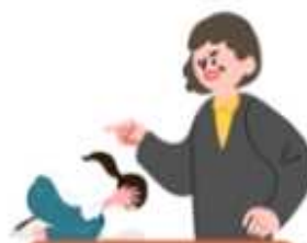
공무집행방해(업무방해), 부당한 간섭

※ 그 밖에 학교장이 「교육공무원법」 제43조제1항에 위반한다고 판단하는 행위도 교육활동 침해가 될 수 있습니다