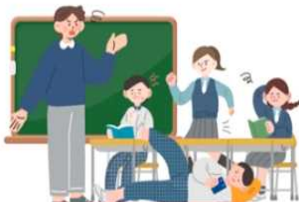
의도적인 수업 방해 행위 (신설)

교원의 정당한 생활지도에 불응하여 의도적으로 교육활동을 방해하는 행위는 교육활동 침해 행위입니다