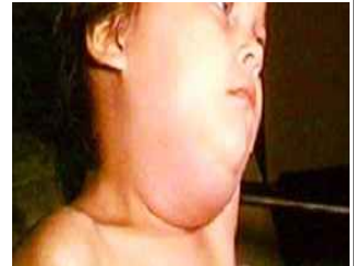
[유행성 이하선염 증상]